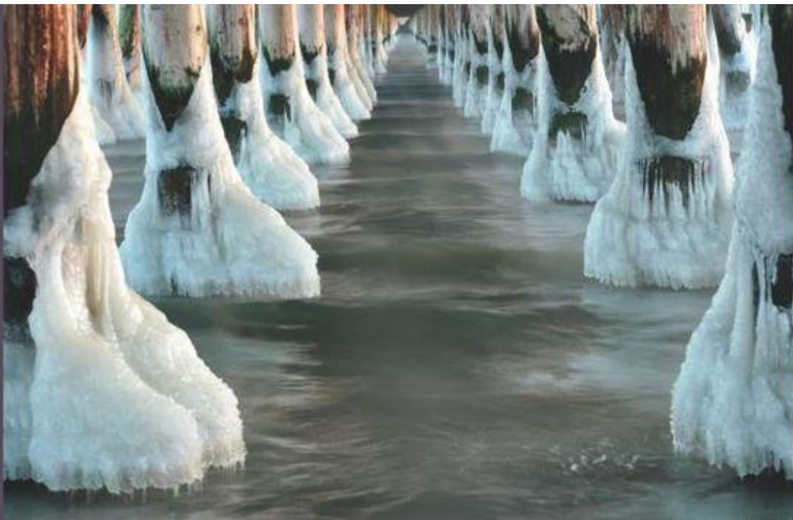
Molo w butach