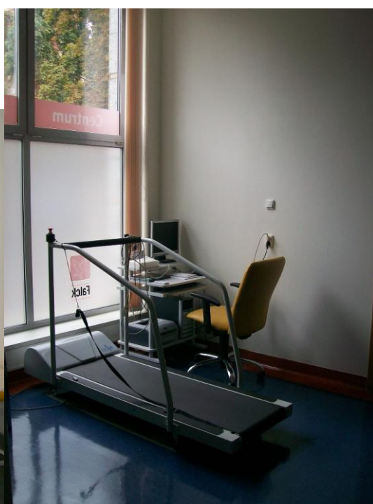
Gabinet ginekologiczny i gabinet z bieżnią do przeprowadzania próby wysiłkowej

W sąsiedztwie Centrum Medycznego znajduje się parking dla Pacjentów w bezpłatnej strefie parkowania.