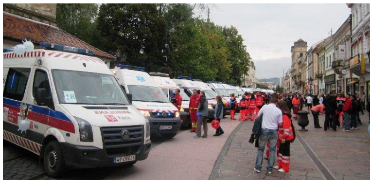
Uroczysta prezentacja zespołów na ulicach Koszyc