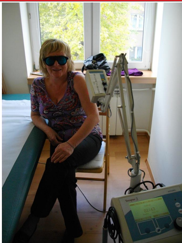
Gabinet fizykoterapii – zabieg z użyciem lasera